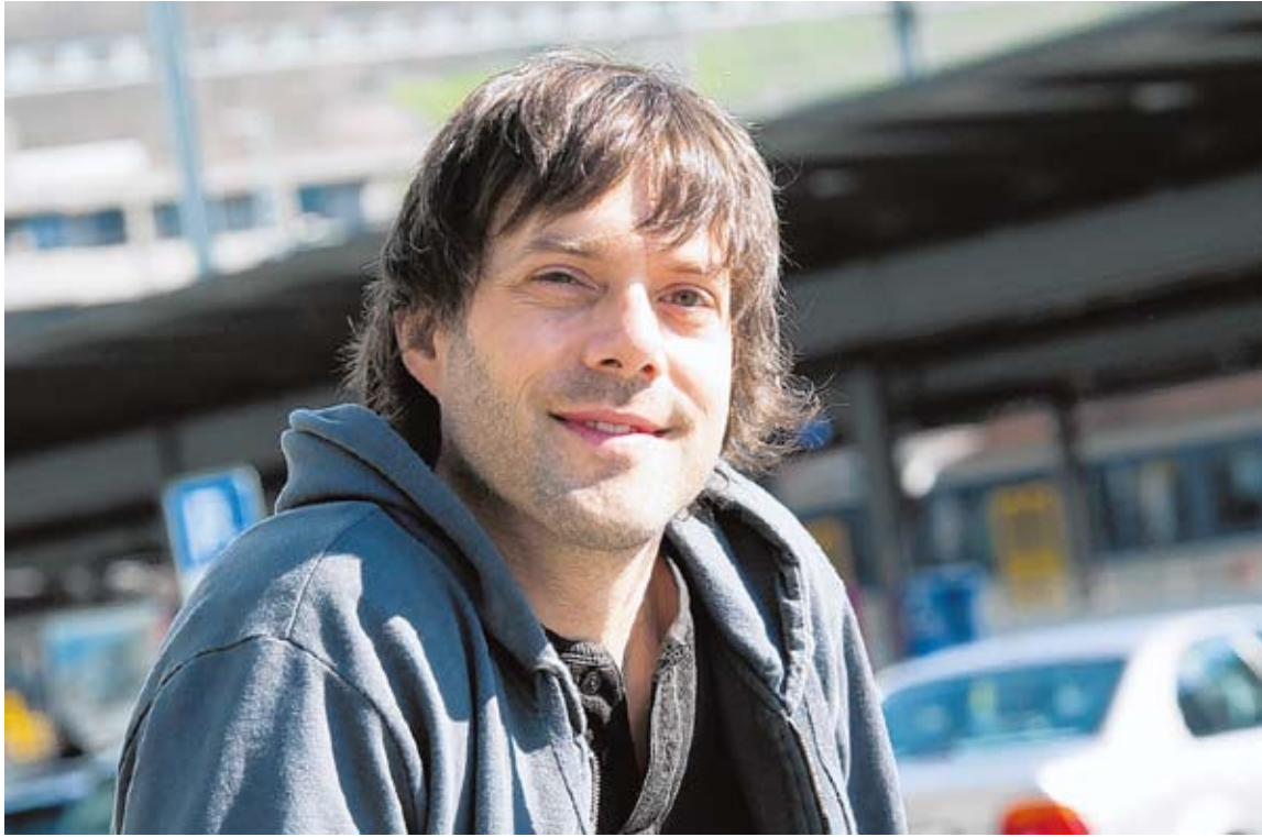
Mit seinem neuesten Album «Herz» hat der etablierte Schweizer Mundartsänger Adrian Stern für 30 000 verkaufte Alben die Platinum-Auszeichnung erhalten.

Hauptact am ersten Abend des diesjährigen Festivals Brütten ist der Auftritt des Aargauer Singer-Songwriters Adrian Stern. Mit seinem aktuellen Album «Herz» feiert der 36-Jährige seine bislang grössten Erfolge; über 30 000 Alben sind bereits über den Ladentisch gegangen.